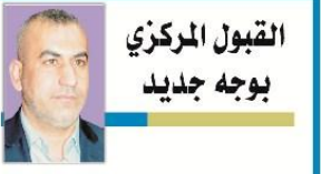
القبول المركزي بوجه جديد