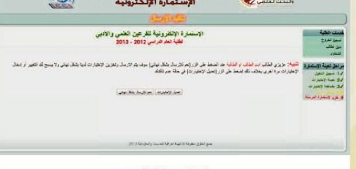
شكل رقم (٦) صفحة التأكيد