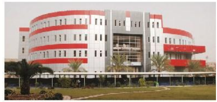
بغداد/ التعليم العالي