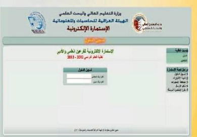
شكل رقم (١) صفحة تسجيل الدخول